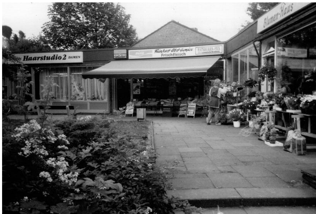
Ehemalige Ladenzeile Beerboomstücken 2, Ecke Borsteler Chaussee