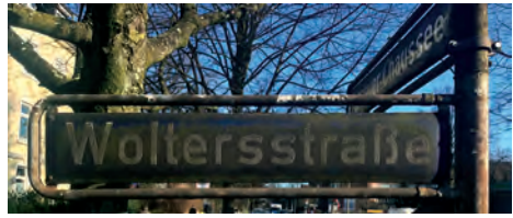
Ihr Strassenschild wartet auf eine pflegende Hand

Es gibt viele Dinge, die Sache des Bezirks oder der Stadt sind: Kaputte Gehwegplatten und